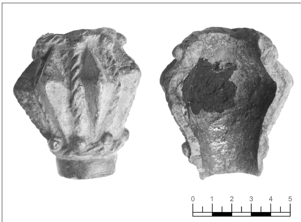
14. kép – Öntött bronz tollas buzogány felének töredéke – a tenyői Szent Péter-monostor területéről